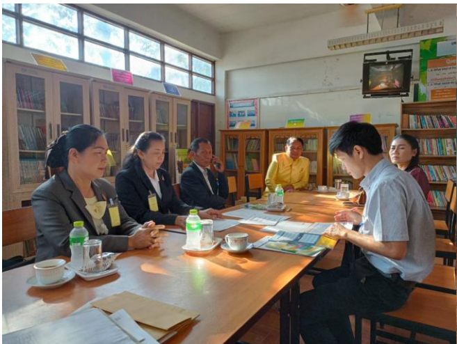
รายละเอียด/ภาพ ประกอบการรายงาน